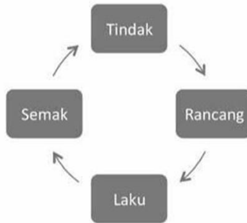
Rajah 1: Proses Kajian Pengajaran